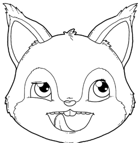
„LICZENIE ZĄBKÓW” – DOTYKANIE CZUBKIEM JĘZYKA KAŻDEGO ZĘBA PO KOLEI.