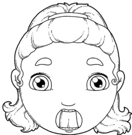
UNOSZENIE JĘZYKA ZA GÓRNE ZĘBY.