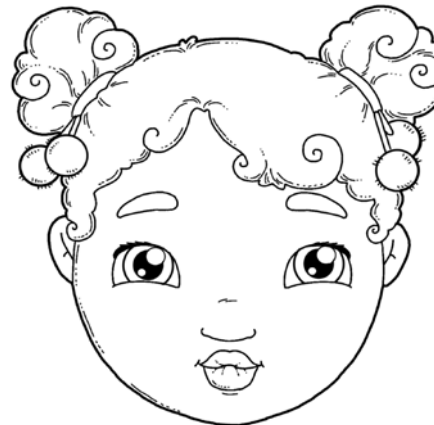
„DZIÓBEK” I SZEROKI UŚMIECH – NAPRZEMIENNIE.