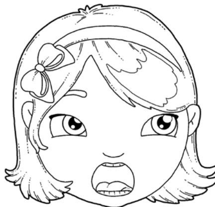
„ODKURZANIE” – PRZESUWANIE CZUBKIEM JĘZYKA PO WEWNĘTRZNEJ POWIERZCHNI DOLNYCH ZĘBÓW (OD LEWEJ DO PRAWEJ STRONY I Z POWROTEM).