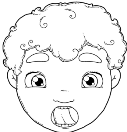
„MYCIE ZĘBÓW” – PRZESUWANIE CZUBKIEM JĘZYKA PO WEWNĘTRZNEJ POWIERZCHNI GÓRNYCH ZĘBÓW (OD LEWEJ DO PRAWEJ STRONY I Z POWROTEM).