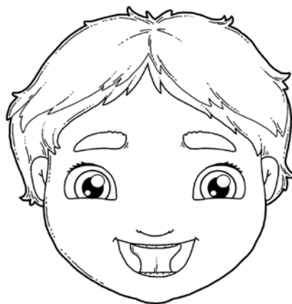
„KŁASKANIE” – NAŚLADOWANIE DŹWIĘKU KOPYT PORUSZAJĄCEGO SIĘ KONIA (ZE ZMIANĄ TEMPA).