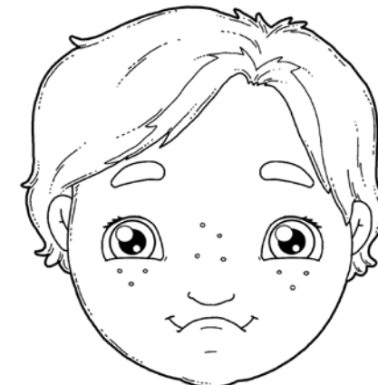
„PRACUJĄCE DŹWIGI” – NAKŁADANIE NA SIEBIE NAJPIERW DOLNEJ, A NASTĘPNIE GÓRNEJ WARGI.