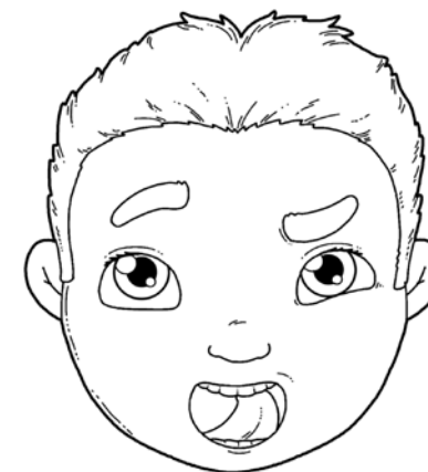
„LICZENIE ZĄBKÓW” – DOTYKANIE CZUBKIEM JĘZYKA KAŻDEGO ZĘBA PO KOLEI.